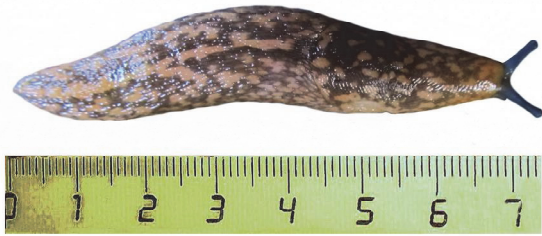
РИС. 1. Внешний вид слизня Limacus flavus из г. Гомеля. FIG. 1. Habitus of the slug Limacus flavus from the city of Gomel.