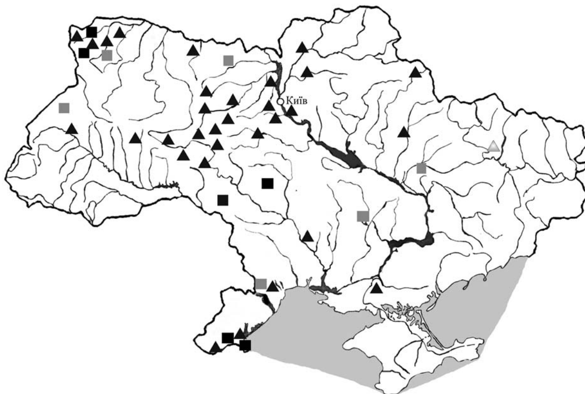
РИС. 1. Места сбора Planorbis carinatus (квадраты) и Anisus vorticulus (треугольники). Серые квадраты и треугольники — литературные данные; черные — данные авторов.